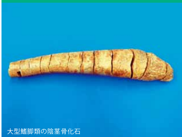
大型鰭脚類の陰莖骨化石

※アロデスムスは約 1300 万年前頃に生息していた大型海生哺乳類で、鰭脚類（アシカやセイウチの仲間）と共通の祖先から進化し、約 1000 万年前に絶滅したとされています。