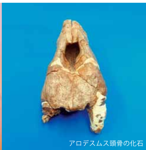
アロデスムス頭骨の化石

平成 28 年 3 月 23 日に 「アロデスムス頭骨の化石」と「大型鰭脚類の陰莖骨化石」が 松本市特別天然記念物に指定されました。 四賀化石館でぜひご覧ください。