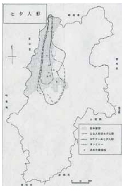
図2 七夕人形が飾られる範囲など(参考文献1所収)

る、七夕のときに七夕人形と呼ぶ人形を飾るなどの事象は、松本藩領だけに限られていることがわかります(図2)。あめ市の開催場所や七夕人形を飾る地域の分布をみると、善光寺街道や千国街道などの街道が大きな役割を果たしたのでしょうか。松本城下町から周縁・周辺へ、周辺・