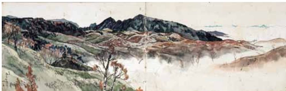
写生帳『箱根 其他富士』より

のご遺族から、寄贈を前提に写生帳・野帳・卷子・写真などの資料一式をお預かりし、現在は資料整理を進めています。