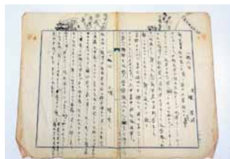
日記(昭和7年2月26日・27日)