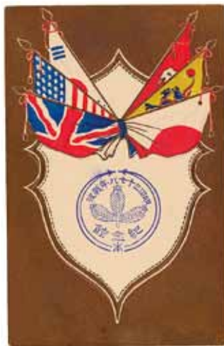
明治三十七、八年戦役記念館のスタンプが押された絵葉書 日露戦争では、戦地の情報を伝える最先端のメディアとして絵葉書が使われた。現在では、当時の歴史を振り返る貴重な資料となっている。

松本市立博物館は、明治39年（1906）9月21日、当時の松本尋常高等小学校（以下「小学校」と略す）内に「明治三十七、八年戦役記念館（以下「戦役記念館」と略す）」として産声を上げました。開館当初の収集品、陳列品の多くは、明治三十七、八年戦役（日露戦争）に出征した松本出身の兵士が小学校に贈った戦役品でした。戦役品には、ロ