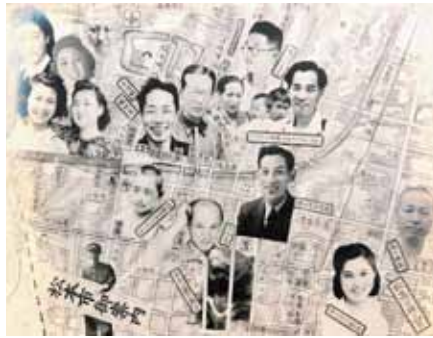
昭和17(1942)年の卒業アルバムから

全国各地から進学のために集まった旧制松本高校生(以下、松高生)たち。理科乙類クラスの第22回(昭和17年)卒業アルバムに収められていた地図を中心に、彼らがどのような場所で青春を過ごしたのかをさぐります。