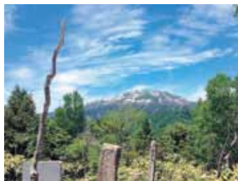
野麦峠から見る乗鞍岳

現在では、松本から高山までは国道やトンネルが整備され、冬でも快適に往来できるようになりました。しかし、街道を考えると、現在の道路を自動車でたどってしまうと、本来の街道の姿はかえって見えにくくなります。