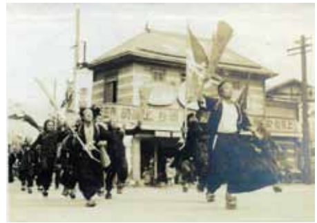
駅伝の前日応援の様子