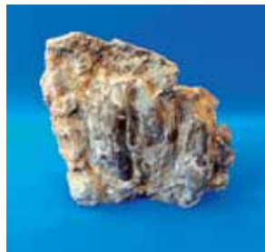
シロウリガイ類が密集した化石

シロウリガイ類の特殊な生態を説明することで、松本市にかつてあった深海の存在にせまります。