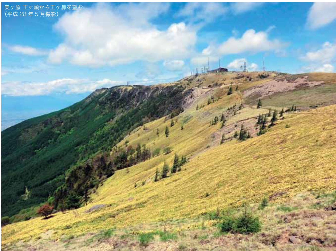
美ヶ原 王ヶ頭から王ヶ鼻を望む (平成28年5月撮影)

平成28年8月11日の「山の日」施行を記念して、第1回「山の日」記念全国大会が松本市で開催されます。世界で初めての「山」を対象とした祝日の誕生を機に、長野県内では山の魅力や価値を発信する様々な行事が開催されます。この夏、松本市立博物館、松本市山と自然博物館では、山をテーマとする展覧会を開催します。