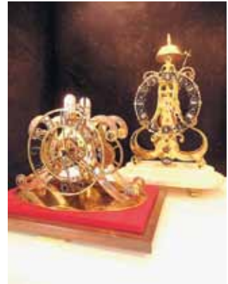
スケルトンクロック