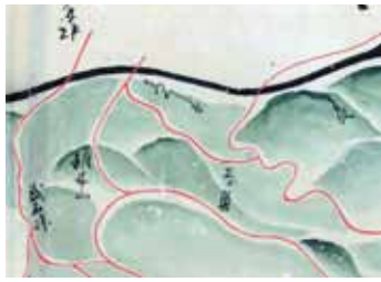
『信濃国松本藩領大絵図』松本城管理事務所蔵

美ヶ原という地名には、どこもなく近代的な響きがありますが、実は江戸時代からその名がありました。江戸時代中期、享保9年(1724)に松本藩主水野氏によって編纂された『信府統記』には、「(前略)うつくしが原と云あり此原は山の上の平にて凡そ二三里に及へり是より富士山其外近国の大山皆見ゆ(後略)」と記載があり、現在と同じく眺望に優れた場所であったことがわかります。同じく水野氏によって作られた『信濃国松本藩領大絵図』にも、「うつくしが原」・「王が鼻」の地名を読み取ることができます(上図)。