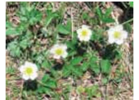
シロバナノヘビイチゴ(王ヶ頭下)

美ヶ原は標高2000m前後の高原ですが、多数の植物がみられ、このうち高山植物は200種類ほどあるといわれます。本来は標高2500m以上で生育する高山植物が亜高山帯である美ヶ原で生育できる要因は、南西(谷側)からの強風や不安定な土壌などと考えられています。それらによって高山帯に近い環境となり、コケモモやヤナギランといった植物が生育しています。しかし近年、高山植物は減少傾向にあります。要因としては、人による乱獲、シカの食害、ササの繁茂などが挙げられます。