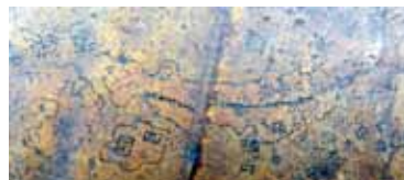
地球儀に描かれた日本

時ごとに時報が鳴りますが、時報の鐘が底部に置いてあるのは珍しい機構です（多くの時計は機械の上部に取り付けてあります）。「大日本山河図」と記された地球儀を備え、見えにくいですが「印度」や「南大西洋」などの文字も記されています。日本列島も確認しづらいですが、「四国」や「神戸」の表記が見られます。