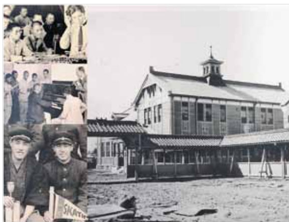
写真に収められている講堂は現在も市民に活用され、親しまれている。

この資料は、旧制松本高等学校(以下「松高」)校舎が現在のあがたの森に完成した際に発行された写真集です。