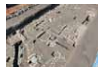
井川城跡の発掘状況 (主郭南西部の礎石建物跡)